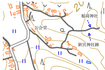
礎石状の石がある