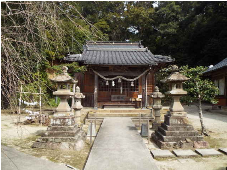
熊野神社（西川津町市成）